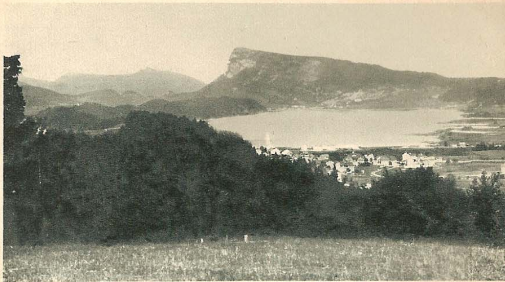
Vue générale de la Vallée de Joux.