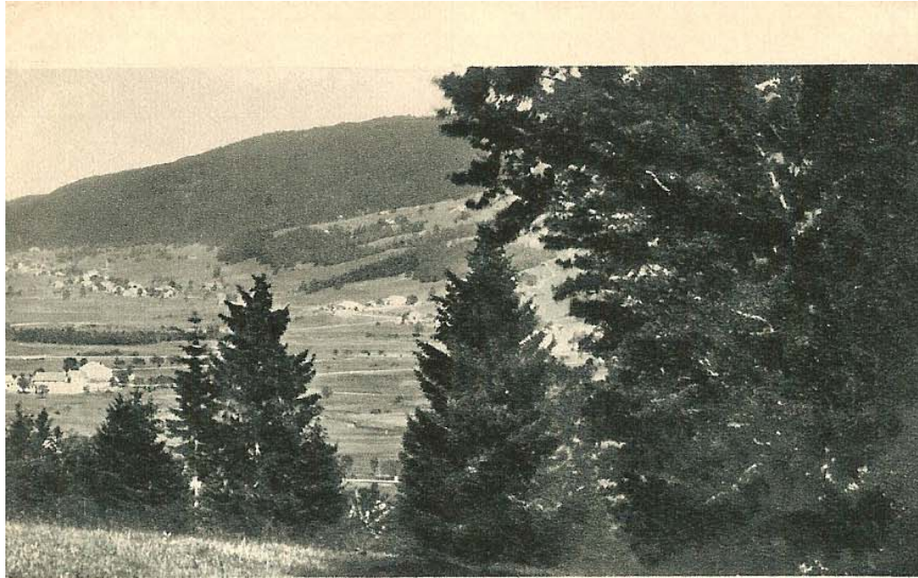
c et la Dent de Vaulion